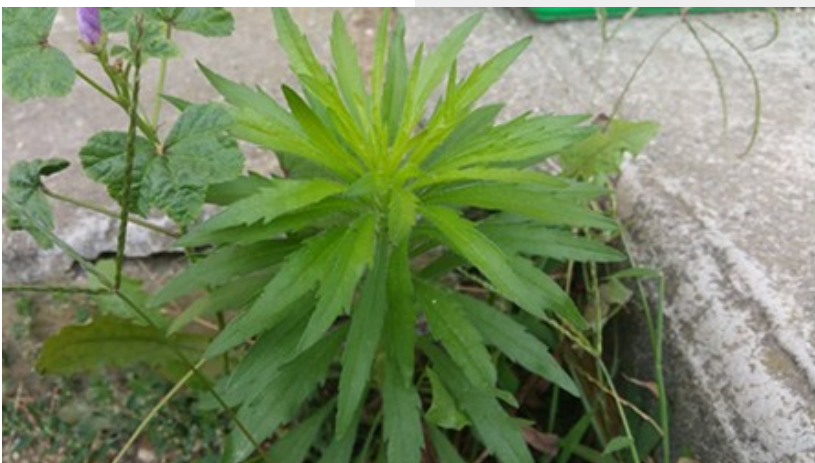
L'érigéron du Canada, appelée aussi Vergerette du Canada

Alors soyons patients dans cette période de transition et dans quelques années, les cimetières de Val-de-Livenne seront verdoyants et plus agréables.